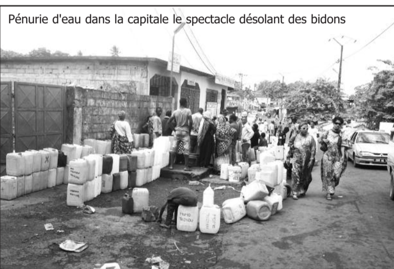
Pénurie d'eau dans la capitale le spectacle désolant des bidons

borne fontaine est toujours alimentée par la réserve d'eau de