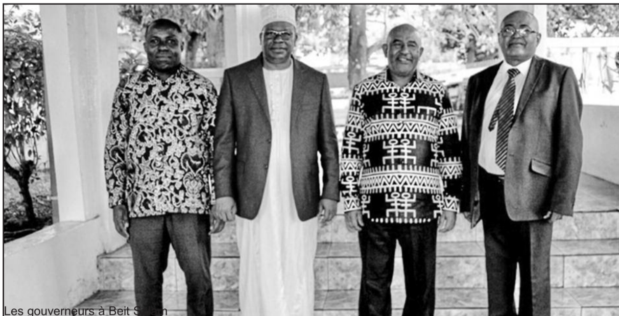
Les gouverneurs à Beit Salam