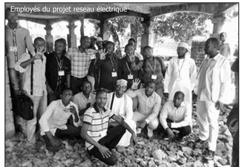
Employés du projet reseau électrique