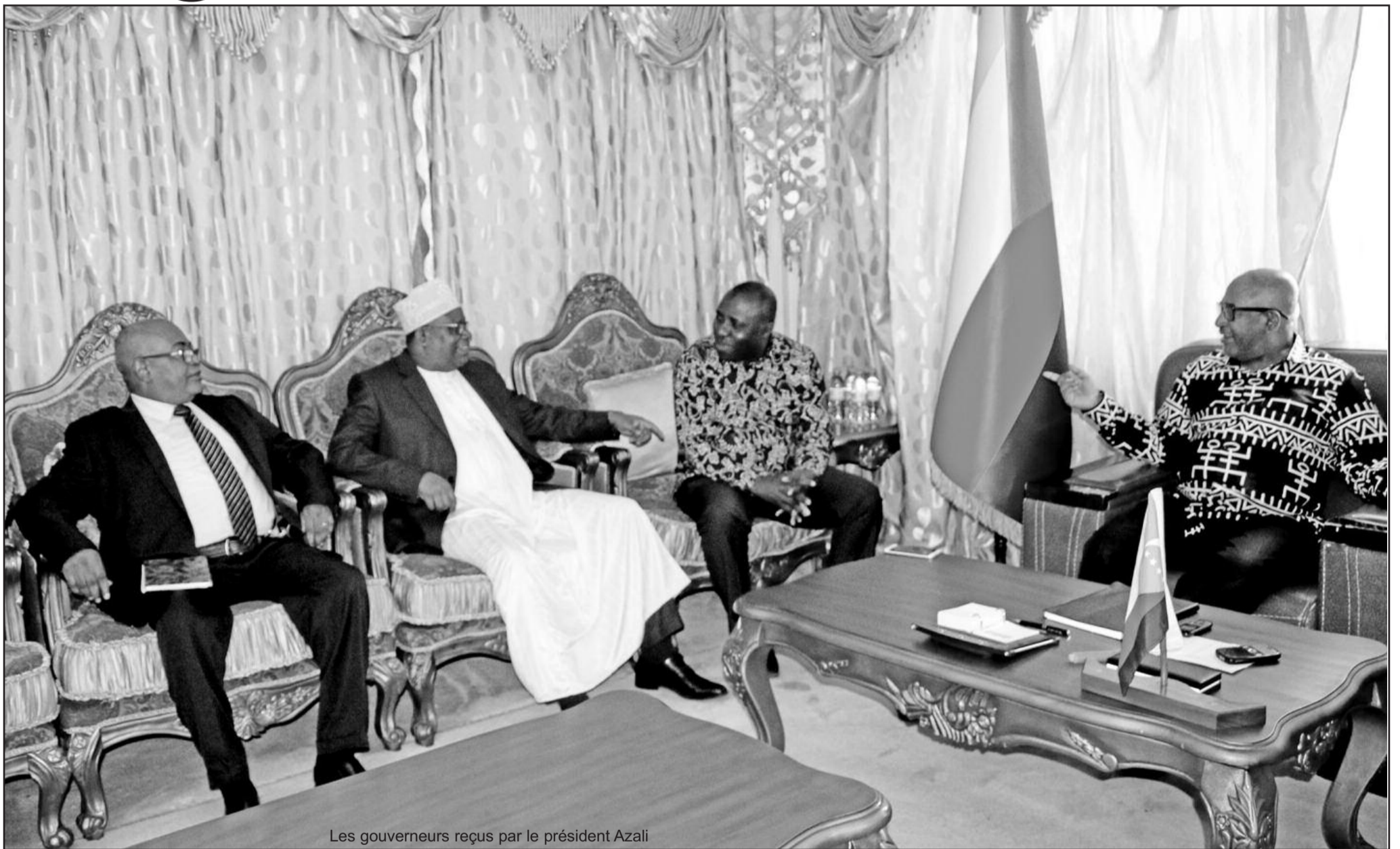
Les gouverneurs reçus par le président Azali